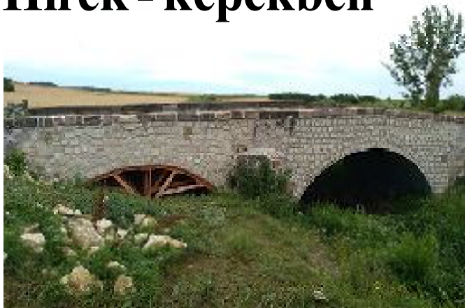
A felújított kőhíd.