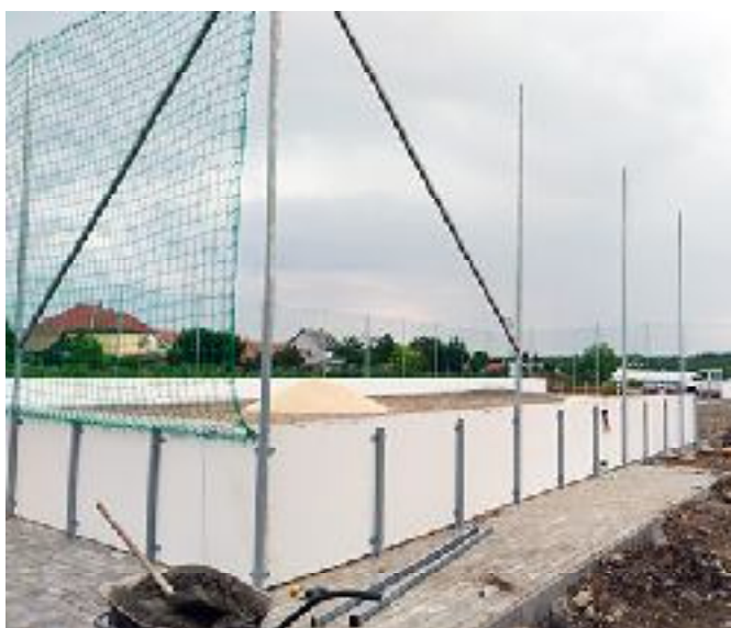
Épül a műfüves pálya.