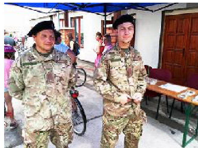
Területvédelmi tartalékosok toborzása.