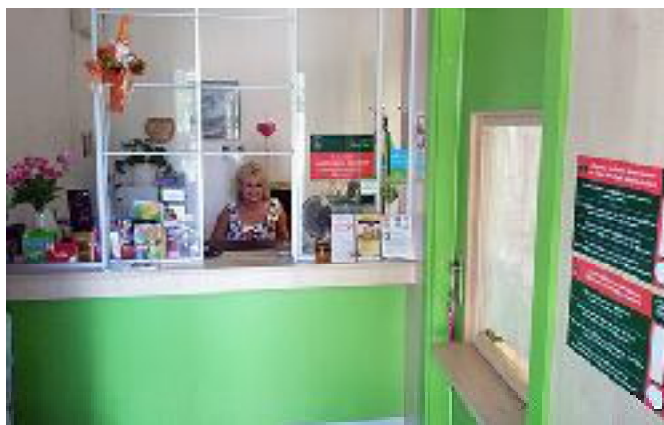
Új helyen, a Kossuth u. 68. szám alatti üzemenl a posta.

Míg sok szomszédos településen csak mozgó postai szolgáltatás működik, addig nálunk sikerült a postának egy új helyiséget biztosítani. A posta változatlan szolgáltatásokkal 2018. májusától a Héhalom Kossuth u. 68. szám alatti üzemenl.