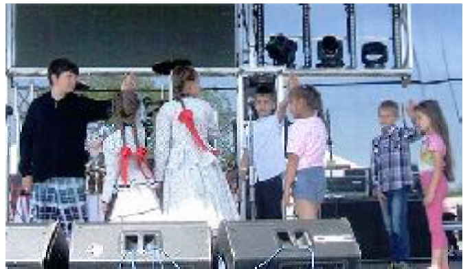
A böllérfesztiválon is szerepeltünk