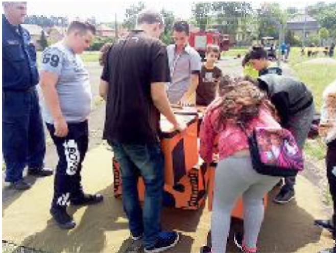
A katasztrófavédelmi akadályversenyen.