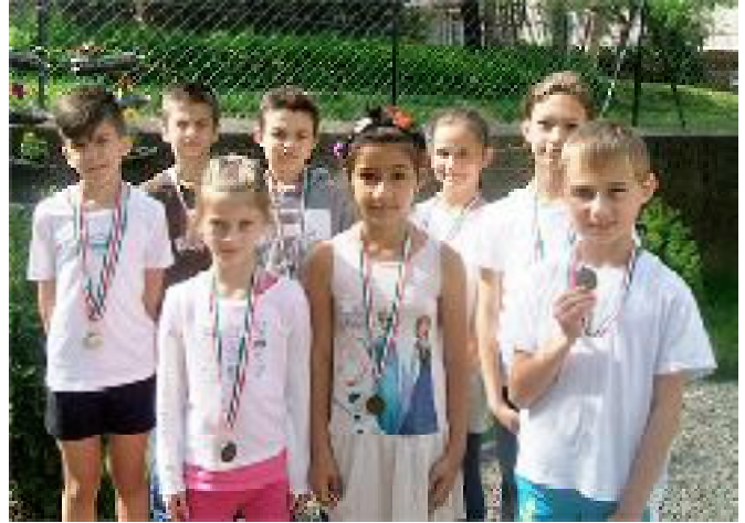
A pásztói atlétikai verseny résztvevői és érmesei

* Továbbá bentlakásos táborba is eljuthatnak legjobbaink a Tisza-tóhoz – tanulmányi munkájuk, szorgalmuk és magatartásuk függvényében. A programok megvalósítását és fedezetét egy nyertes EFOP pályázat és nem utolsósorban a kollégák lelkes és odaadó munkája segíti.