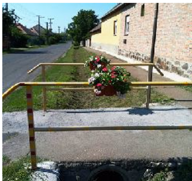
Virágok a gyalogos hídon.