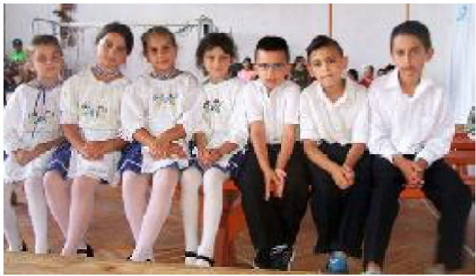
A „Sej a tari réten...” című néptánc-találkozó héhalmi résztvevői