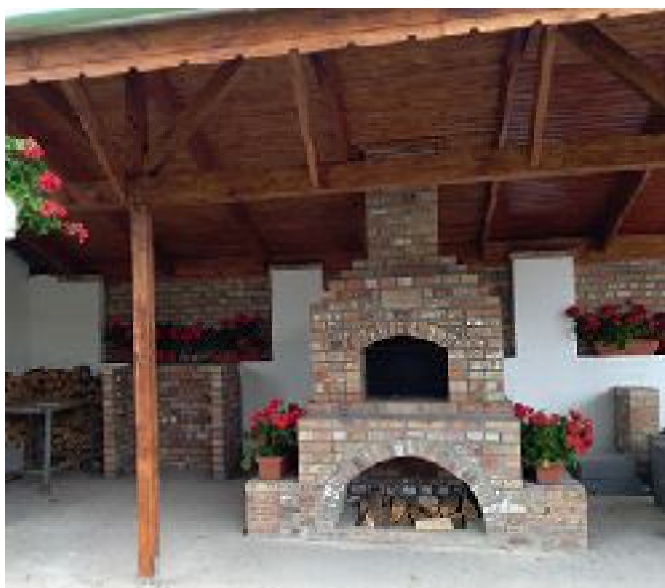
A falu kemencéje. - Köszönjük a sok segítséget Lőrincz Csabának.