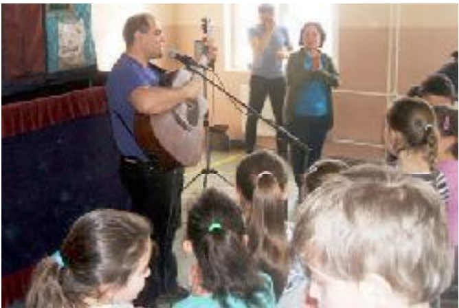
A Palánta bábelőadásán.