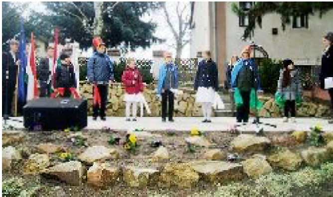
Március 15-iki műsor